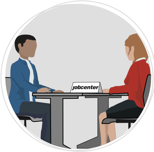
Beratung und Vermittlung durch das Jobcenter