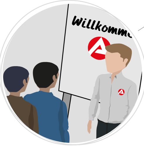
Arbeitsmarktliche Information durch die Agenturen für Arbeit